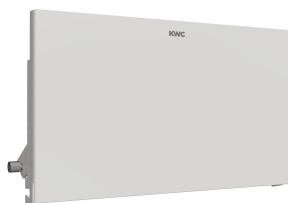
EXOS. front met wit veiligheidsglas