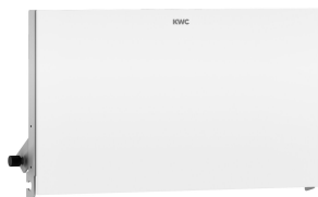
Parte frontal con cristal ESG blanco EXOS.