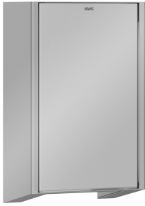
EXOS. Frontabdeckungen für EXOS. Händetrockner