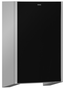
EXOS. Frontabdeckung mit schwarzem ESG-Glas