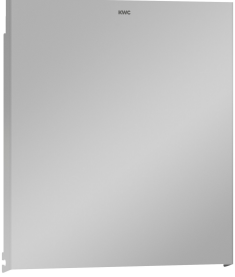
EXOS. Front ze stali chromowo-niklowej

Aksesoria łazienkowe | Podajniki ręczników papierowych