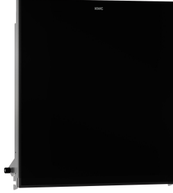
EXOS. Front z czarnym szkłem ESG