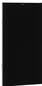
EXOS. Front mit schwarzem ESG-Glas