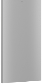
EXOS. Utbytbar frontpanel

Modell-Linie: EXOS | EXOS605EW Sanitetsutrustning | Avfallsbehållare