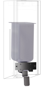
Kit de conversión para dispensador de jabón líquido EXOS.