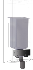
Kit de transformation pour distributeur de savon liquide EXOS.