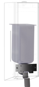
Kit di conversione per distributore di sapone liquido EXOS.