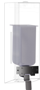
EXOS. Zestaw do modyfikacji dozownika mydła w płynie