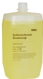
Foam soap cartridge