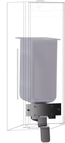
EXOS. Konverteringssats för tvåldispenser för flytande tvål