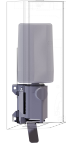
Kit di conversione per distributore di sapone in schiuma EXOS.