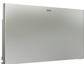
EXOS. Edelstahlfront für EXOS. WC-Doppelrollenhalter zur Unterputzmontage

Modell-Linie: EXOS | EXOS676EW Accessories | WC-Rollenhalter