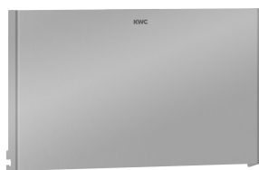
Parte frontal de acero de cromo- níquel EXOS.

Modell-Linie: EXOS | EXOS676W Accesorios | Portarrollos