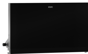
Parte frontal con cristal ESG negro EXOS.