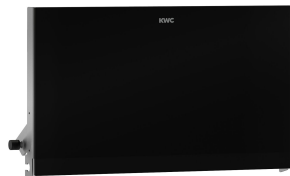
Pannello frontale con vetro ESG nero EXOS.