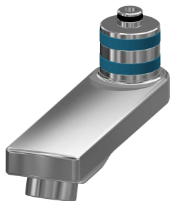
Bocca orientabile, 100 mm

Rubinerie per bagni | Rubinerie temporizzate