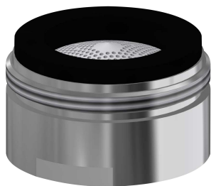
Regolatore del getto