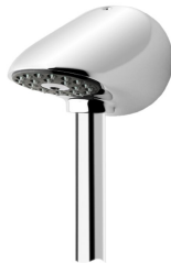
AQUAJET-Slimline Stömlinjeformat duschhuvud