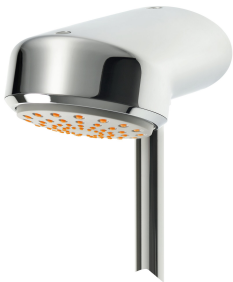
AQUAJET-Comfort shower head