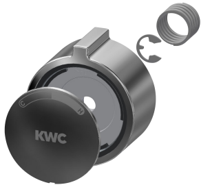
Tlačná krytka rukojeti