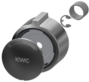
Coperchio a manopola