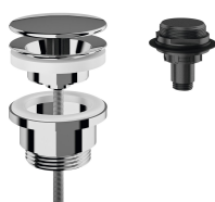
Dome waste valve, chrome-plated