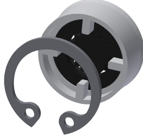
Durchflussmengenregler 12 l/min