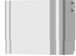
Gehäuseverlängerung für F5-Duschpaneele aus MIRANIT