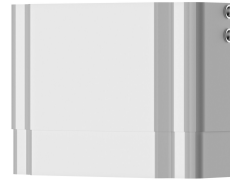
Estensione alloggiamento per pannello doccia F5 in resina MIRANIT