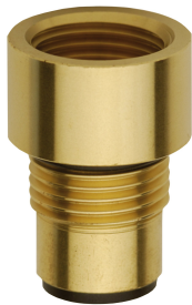
Raccordo per flessibile doccia