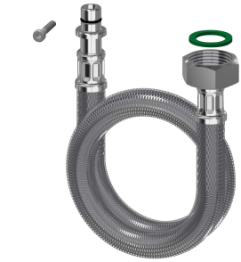
Connecting hose DN10