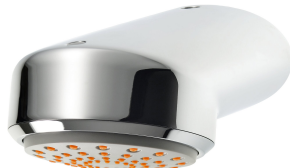
AQUAJET-Comfort Douchekop voor KWC douchepanelen en -systemen