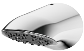
AQUAJET-Slimline Douchekop voor KWC douchepanelen en -systemen