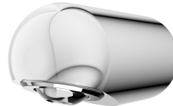
MÜNCHEN Douchekop voor KWC douchepanelen en -systemen