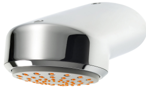
AQUAJET-Comfort Douchekop voor KWC douchepanelen en -systemen