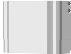
Gehäuseverlängerung für F5-Duschpaneele aus MIRANIT