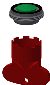
Luftsprudler 5,0 l/min