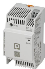
Power supply unit