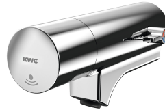
F5E-Mix Elektronik-Waschplatzbatterie für Armatureneinheit oder Wandflansch