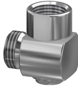
Vanne de vidange pour l'évacuation du flexible de douche