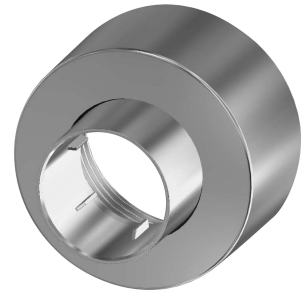
Rosette à vis