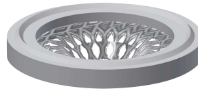
Strainer seal 24 x 17 x 2.5 mm