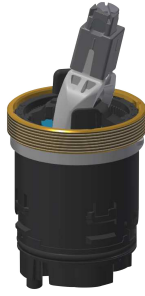
Ceramic disc cartridge