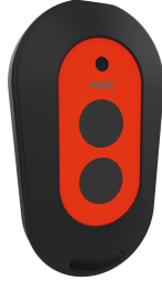
2-Tasten-Fernbedienung für F3 und F5 Armaturen