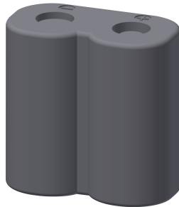
Batería de litio de 6 V