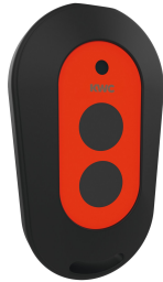
Pilot 2-przyciskowy do armatury F3 i F5