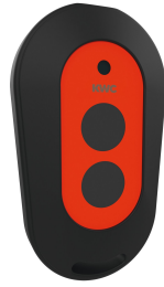
2-button remote control for fittings F3 and F5