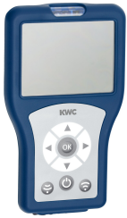
Bidirectional remote control for electronic fittings F3 and F5

Spolssystem | Elektroniska urinoarspolningssystem