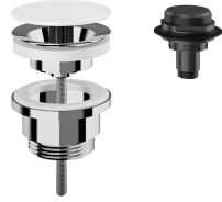
Desagüe de bóveda