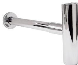
Zawór odpływowy, chromowany