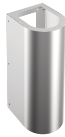
Copri sifone ANIMA