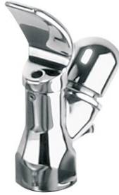
Rubinetto per beverino