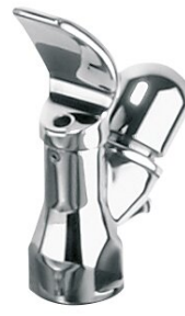
Rubinetto per beverino