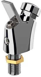
ANIMA Rubinetto per beverino

Modell-Linie: ANIMA | ANMX33L Beverini | Beverini