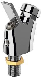
ANIMA Rubinetto per beverino