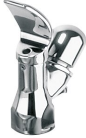
Grifería para fuente de agua