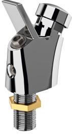
ANIMA Grifo para fuente de agua potable