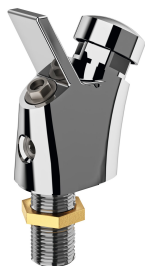
Robinetterie de fontaine à boire ANIMA