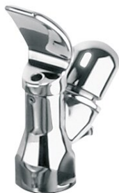
Robinetterie de fontaine à boire