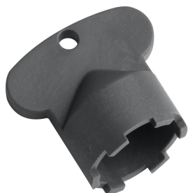
Service clé Neoperl © Caché ©, STD, 24 mm, gris