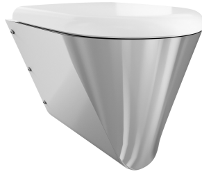
Asiento de inodoro