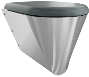
Asiento de inodoro