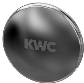
Cappuccio di tenuta

Rubinerie per bagni | Rubinerie temporizzate