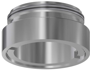
Obudowa do perlatora antykradzieżowego