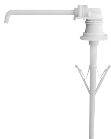
Pompka jednorazowego użytku z tworzywa sztucznego do dozowników MEDCARE