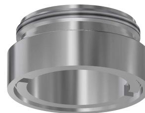
Boîtier d'aérateur antivol