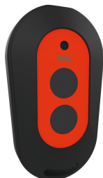
Télécommande à 2 touches