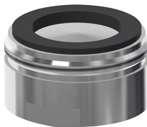
Mousseur 6,0 l/min